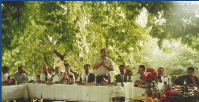
Республика Таджикистан (1996 г.)