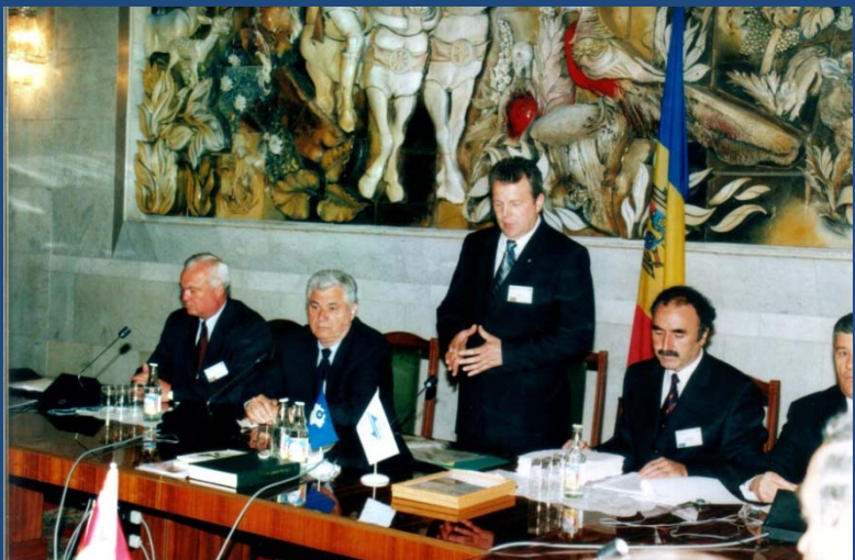
Республика Молдова (1995, 2002 гг.)