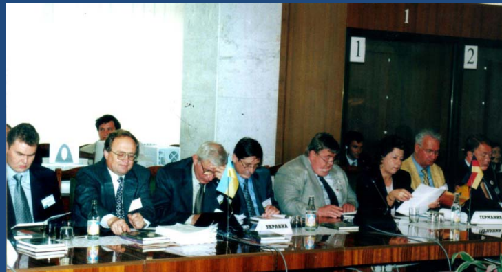
Украина (1993, 1998, 2002 гг.)