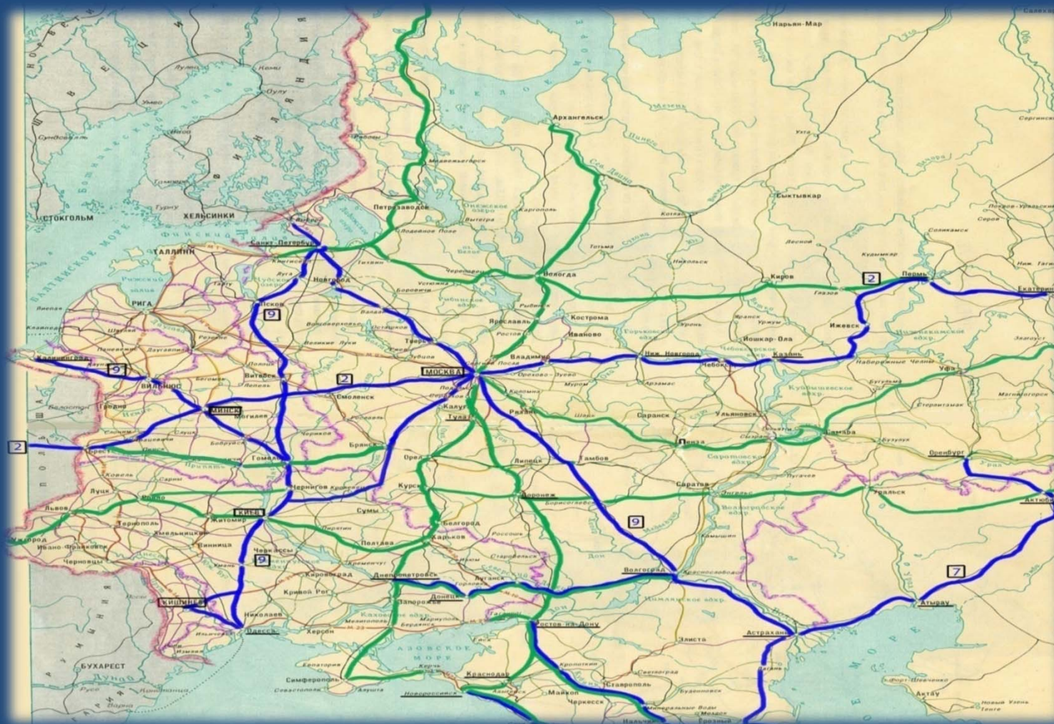
Автомобильные дороги СНГ. Европейская часть