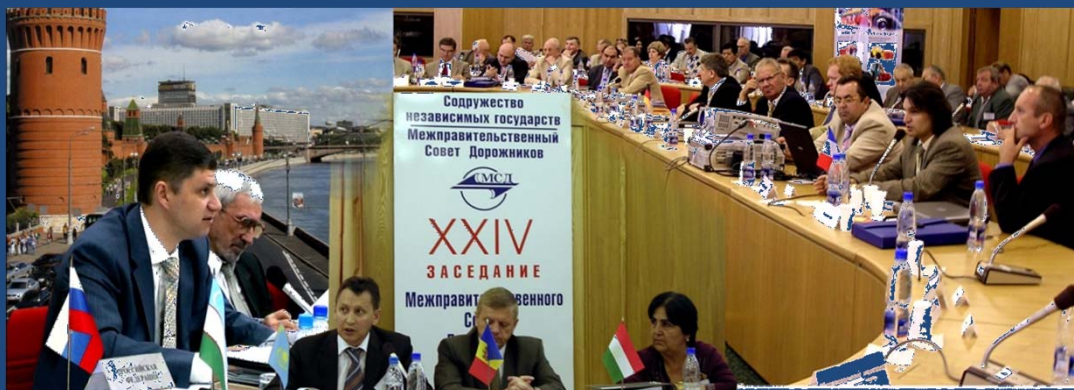
Российская Федерация (1993, 1995, 1996, 1997, 1999, 2000, 2003, 2005, 2007, 2009, 2010, 2012 гг.)