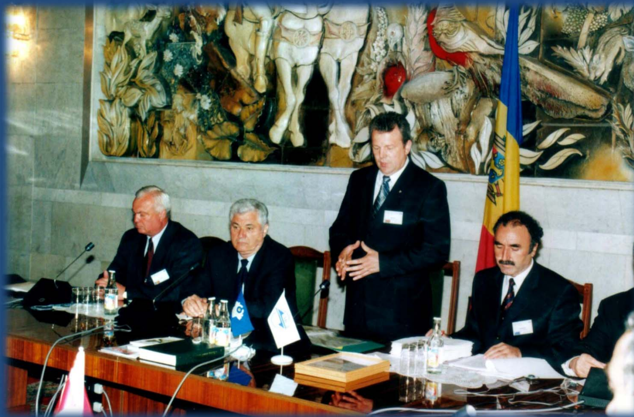
Республика Молдова, г. Кишинев (2002 г.)