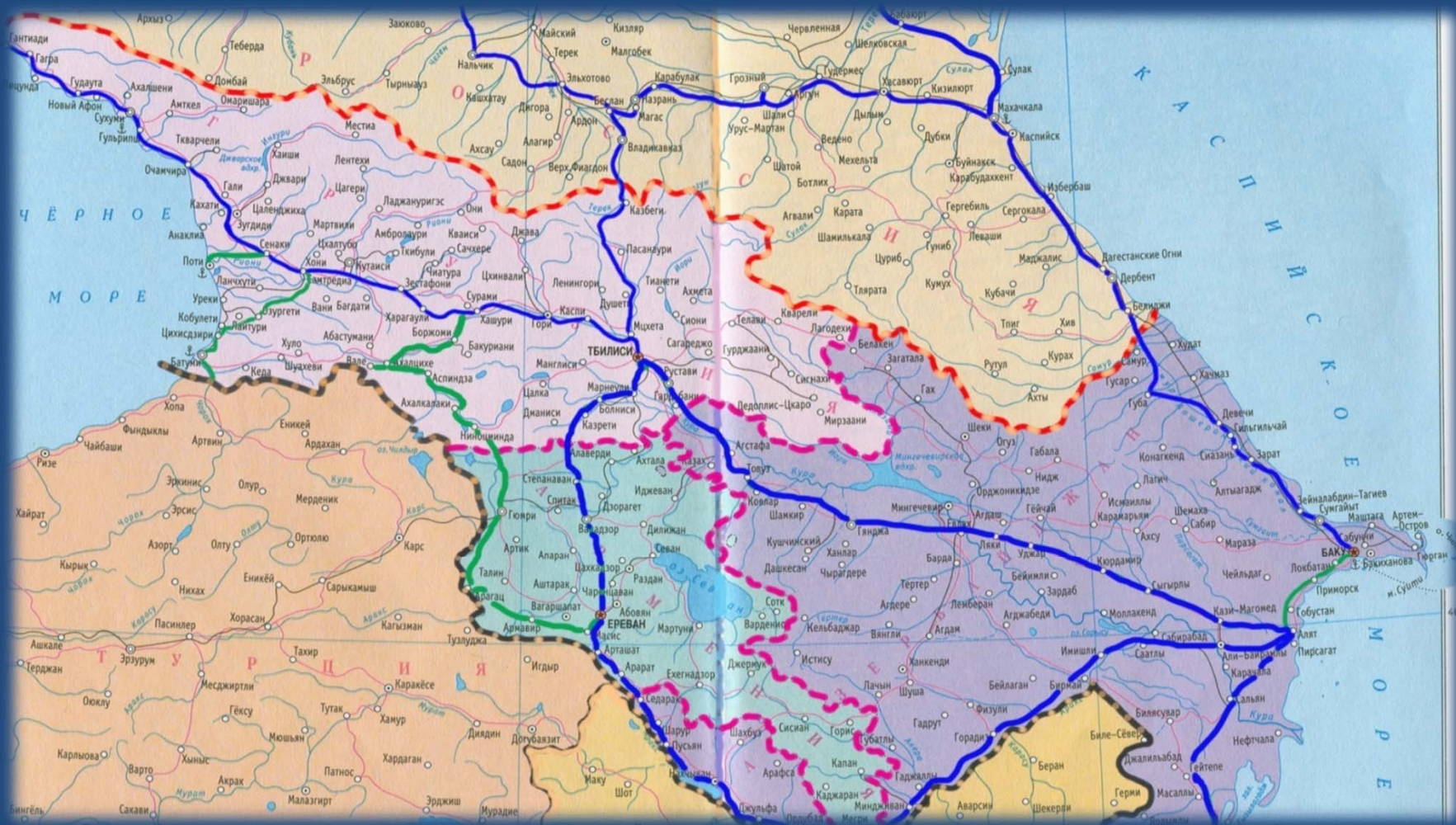
Автомобильные дороги стран СНГ. Кавказ