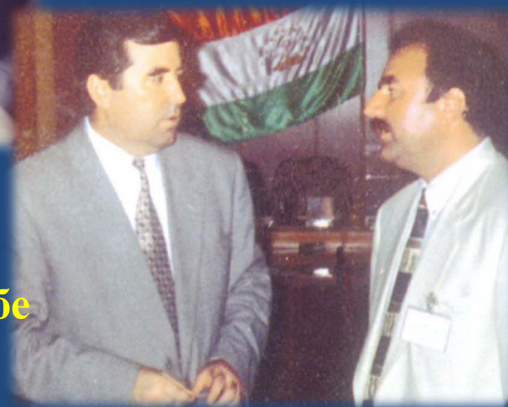
Республика Таджикистан, г. Душанбе (1996 г.)