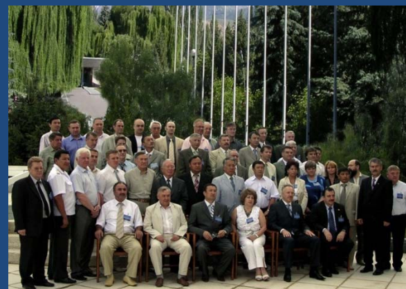
Кыргызская Республика (1999, 2006, 2018 гг.)