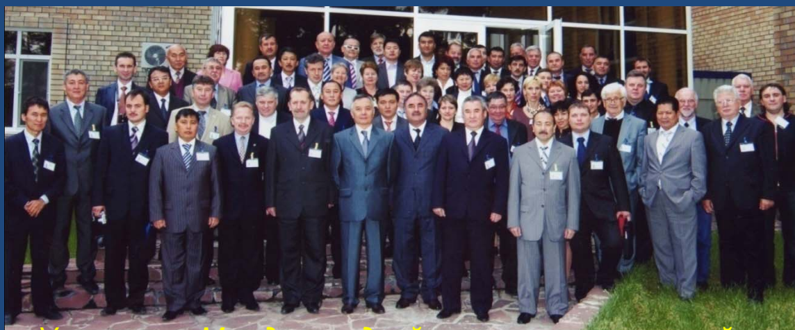
Участники Международной научно-практической конференции (Казахстан)