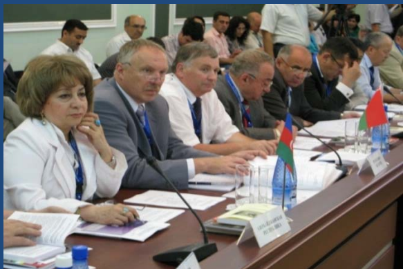
Азербайджанская Республика (2004, 2008 гг.)