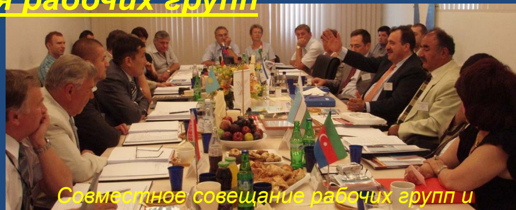
Совместное совещание рабочих групп и ассоциированных членов МСД.