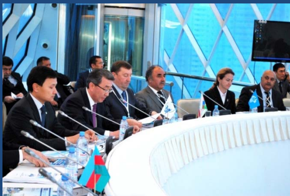
Республика Казахстан (1993, 2001, 2004, 2011 гг.)