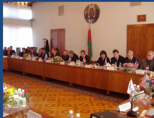
Республика Беларусь (1992, 1997, 2001, 2006 гг.)